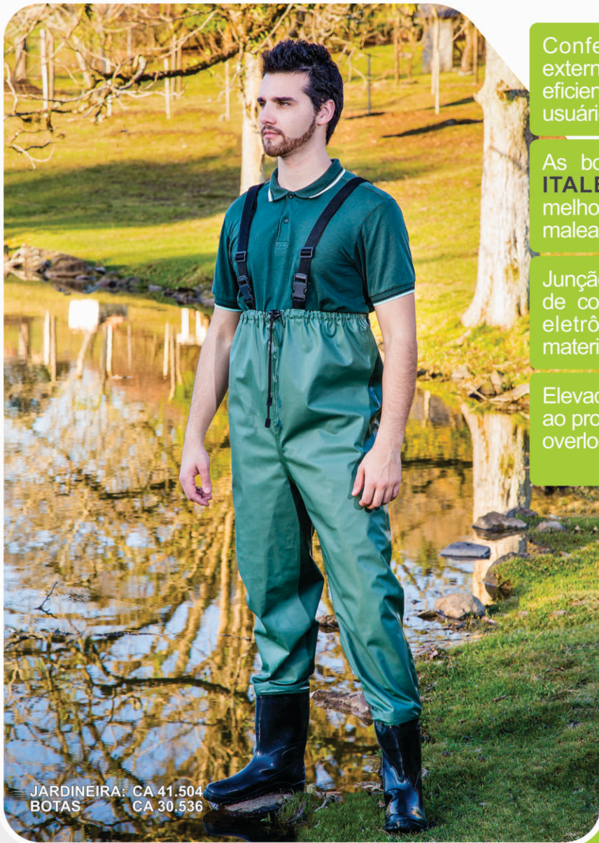
JARDINEIRA: CA 41.504 BOTAS: CA 30.536

Confeccionada em nylon emborrachado externo, permitindo uma higienização mais eficiente do material e um maior conforto do usuário;