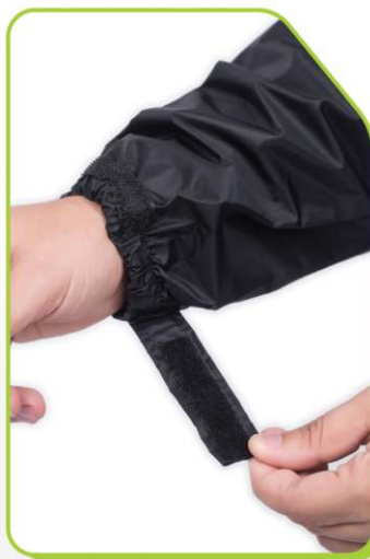
Ajuste duplo com elástico e velcro