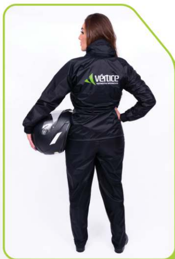
Logo refletivo impresso nas costas