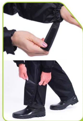
Ajuste duplo nos punhos + ajuste na calça