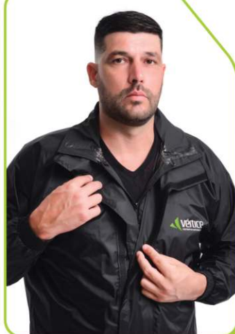
Fechamento frontal duplo com zíper + velcro