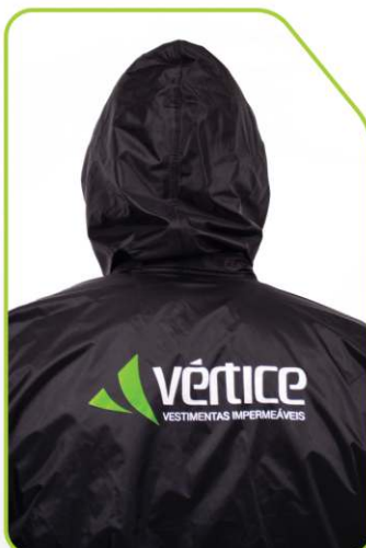
Capuz embutido na gola + logo refletivo