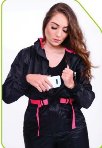
Bolso interno + fechamento frontal duplo