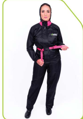
Gola alta e cinto coloridos