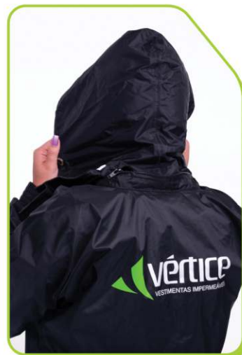
Capuz retrátil embutido na gola alta