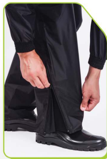
Ajuste com zíper na bainha da calça