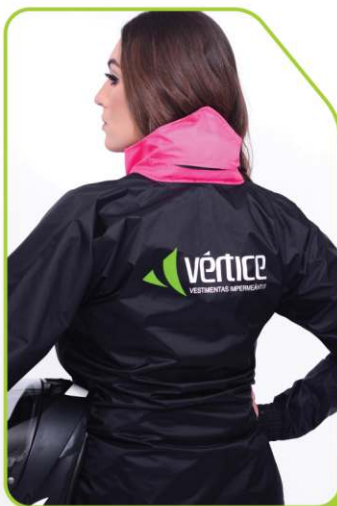
Logo refletivo em silk + gola alta