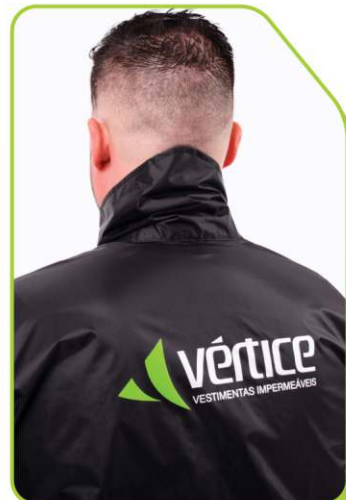
Gola alta + logomarca em silk refletivo